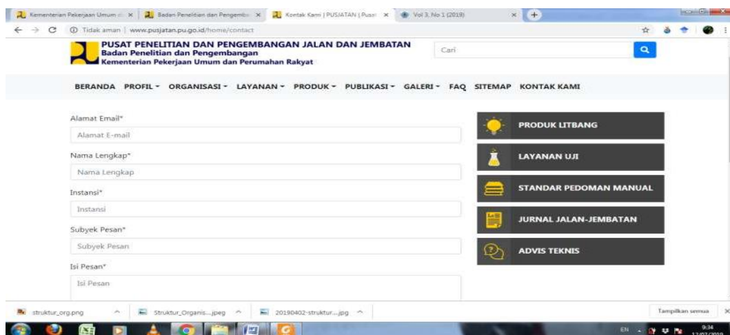
Gambar : media penyampaian pendapat, kritik dan saran ke Pusjatan Bidang SDK Kementerian PUPR

Adanya laman yang memberikan kesempatan bagi siapa saja untuk menyampaikan pesan kepada pusjatan. Hal ini dapat dilihat pada website pusjatan dengan link http://www.pusjatan.pu.go.id/home/contact . Dengan adanya laman tersebut warga negara dapat dengan bebas menyampaikan pendapatnya kepada pihak terkait. Meskipun, tidak dalam waktu singkat pesan tersebut dapat direspon, setidaknya ada tempat untuk menyampaikannya. Dengan dibukanya kesempatan bagi rakyat untuk mengajukan tanggapan dan kritik terhadap pemerintah yang dinilai tidak transparan, maka Pusjatan Bidang SDK – Kementerian PUPR dianggap memiliki keterbukaan kepada para stakeholder di Indonesia.