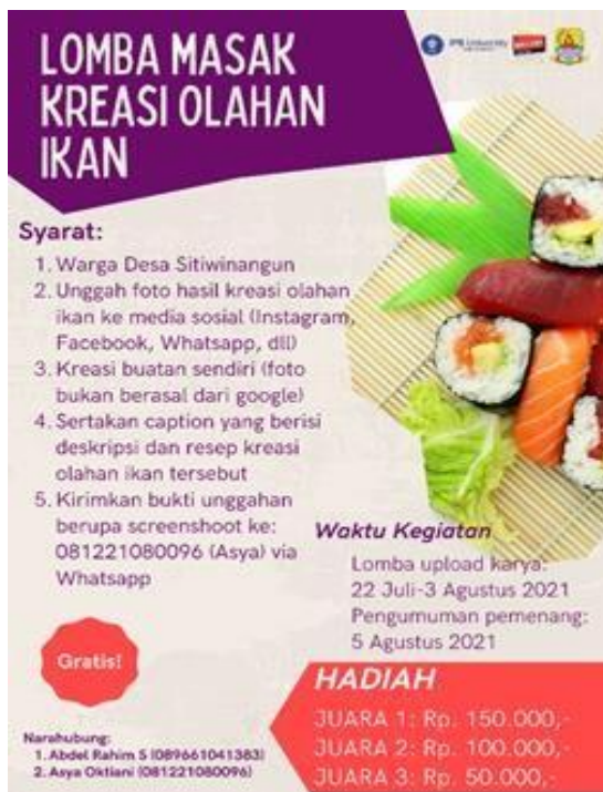
Gambar 1 Poster lomba masak kreasi olahan ikan

Adapun syarat untuk mengikuti perlombaan tersebut merupakan warga desa Sitiwinangun, mengunggah foto hasil kreasi olahan ikan ke salah satu media sosial yang dimiliki, masakan merupakan hasil olahan sendiri, menyertakan caption yang berisikan deskripsi masakan dan resep masakan, serta mengirimkan bukti unggahan tersebut kepada kontak narahubung yang sudah dicantumkan di poster.