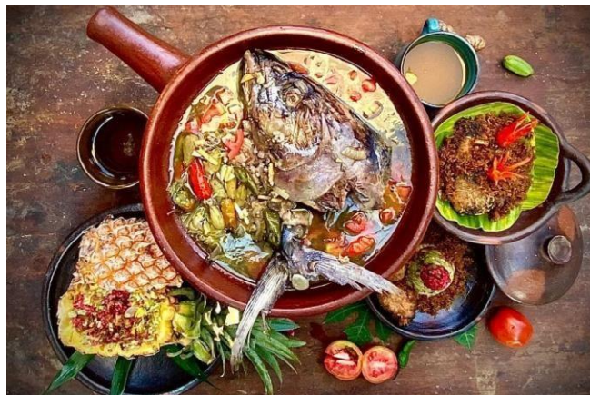
Gambar 4. Juara II “Kepala tuna cabe ijo, Nasi goreng nugget tuna, Tuna kelapa”