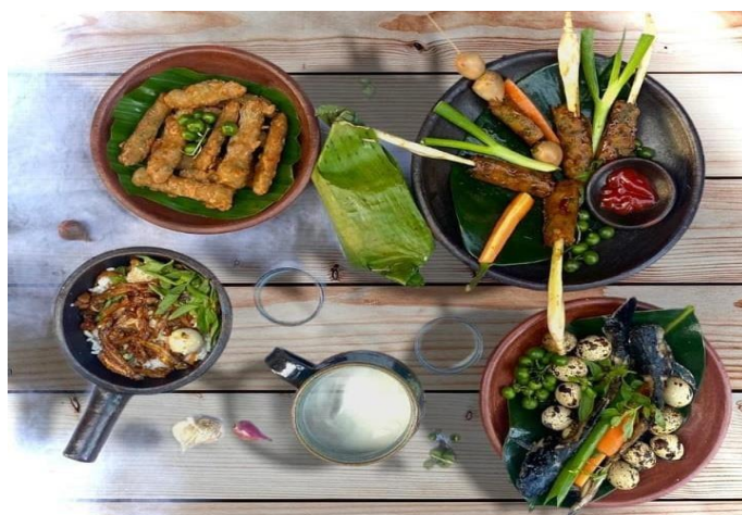
Gambar 5. Juara II “Patin Kriwil”