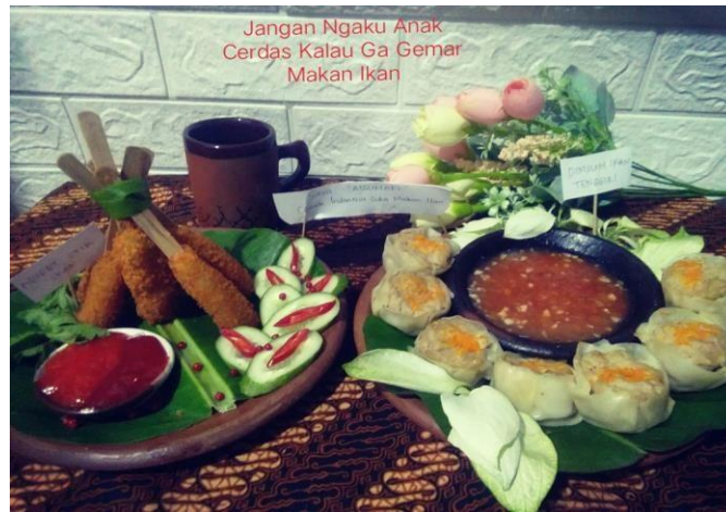
Gambar 3. Juara I “Dimsum dan nugget ikan lele”

lomba antara 22 Juli - 3 Agustus 2021. Hasil lomba peserta juara I, II, dan III dapat dilihat pada gambar berikut.