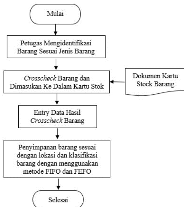
Gambar 2. Alur Penyimpanan Barang ATK di Gudang ATK RSBSA

Berdasarkan hasil observasi dan wawancara yang dilakukan oleh peneliti yaitu proses penyimpanan barang ATK di mulai dengan petugas mengidentifikasi barang sesuai dengan jenis barang untuk dilakukan penyimpanan barang. Barang di crosscheck supaya mengetahui sesuai atau tidaknya barang yang telah diajukan dan yang diterima, lalu dilakukan pencatatan ke dalam kartu stok barang. Setelah dilakukan pencatatan barang, lalu data yang ada pada kartu stok disesuaikan dengan yang ada di entry data sebagai bahan pembanding. Barang di simpan di tempat yang sudah disediakan dan di tandai dengan tulisan yang ditetapkan oleh kepala gudang ATK dengan menggunakan metode FIFO dan FEFO. Adapun alur penyimpanan barang seperti pada gambar di bawah ini :