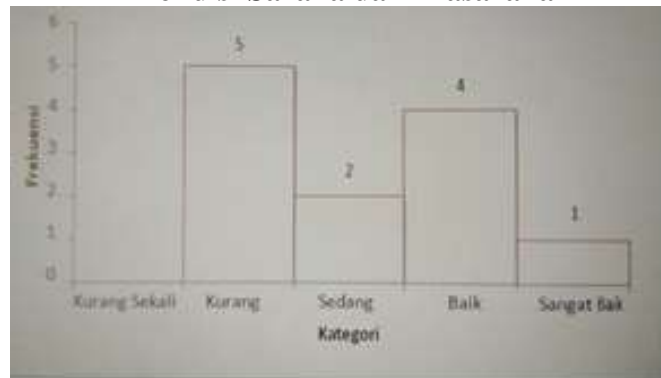
Gambar 02. Histogram Kondisi Sarana dan Prasarana Pendidikan Jasmani.