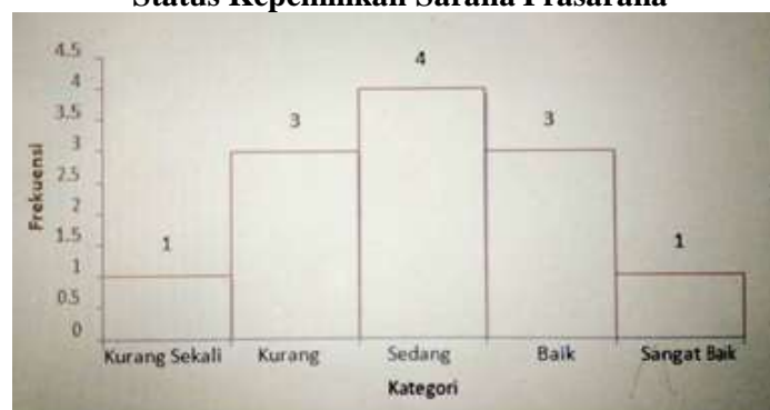
Gambar 4.1 Histogram Status Kepemilikan Sarana dan Prasarana Pendidikan Jasmani.

Dari gambar diatas yang menjelaskan bahwa status kepemilikan sarana dan prasarana pendidikan jasmani di SD Negeri se-Kecamatan Jatisari Kabupaten Karawang dapat disimpulkan. Status kepemilikan sarana dan prasarana yang kurang sekali hanya terdapat pada 1 SD dengan 8,3%.