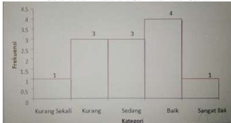
Gambar 04. Histogram Kategorisasi Sarana dan Prasarana SD Negeri se- Kecamatan Jatisar Kabupaten Karawang.