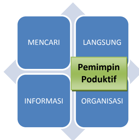
Gambar 3 : Syarat Pemimpin Produktif

Maka untuk itu penulis mengusulkan pendapat bahwa seorang pemimpin yang sukses harus berani untuk MILO yaitu kepemimpinan yang 1) Mencari ide, gagasan ilmu pengetahuan guna untuk meningkatkan kecerdasan yang lebih daripada pada bahwahnya supaya dapat menngambil keputusan secara tepat dan cepat yang selalu kekinian up to date atau terbaru. 2) Informasi harus jelas dan ilmiah sehingga dapat dipertanggung jawabkan kepada semua pihak dalam pengambilan keputusan. 3) Langsung melakukan koordinasi dan kerjasama dengan berbagai pihak yang berkepentingan dalam organisasi. 4) Organisasi merupakan sumber informasi yang harus diperbaharui dan di perbaiki, sehingga orang-orang yang berada dalam organisasi mampu beradaptasi kedalam situasi dan kondisi apapun Abduloh (2015). Apabila digambarkan syarat pemimpin yang produktif sebagai berikut: