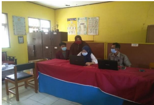
Gambar 1 Sosialisasi media belajar daring

Penjelasan mengenai aplikasi google meet dan google classroom dipaparkan secara langsung oleh mahasiswa, sekaligus para guru mencoba secara langsung agar mereka lebih mudah untuk memahaminya. Selama kegiatan sosialisasi berlangsung, para guru sangat antusias dalam mendengarkan dan mempraktekkan instruksi yang diberikan. Selain itu, guru aktif bertanya pada saat sosialisasi penggunaan media pembelajaran daring yang dilakukan oleh mahasiswa.