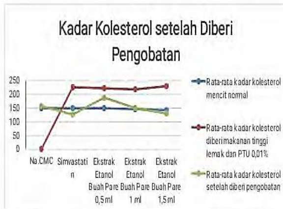
Grafik 1.2. Pengukuran Kadar Kolesterol Darah Mencit Hiperkolesterolemia dan Hasil Setelah Perlakuan