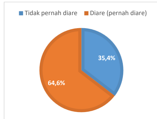
Gambar 2: Distribusi frekuensi kelompok diare

responden sebagian besar menunjukkan bahwa yang diberikan susu formula lebih banyak dibandingkan yang tidak diberikan susu formula.