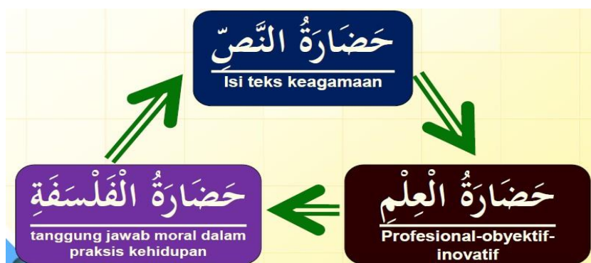
Gambar 2: Komitmen Dasar Kurikulum 2002 dalam Mengkaji Islam Secara Interdisiplin