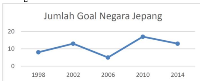
Gambar 4. Tabel Grafik Jumlah Goal Negara Jepang

Pertanyaan : Pada Asian games tahun berapa terjadi penurunan jumlah goal terbesar untuk negara Jepang? (Putri dan Zulkardi, 2018)