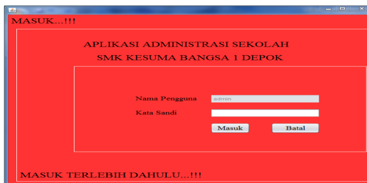
Gambar 1. Tampilan Masuk