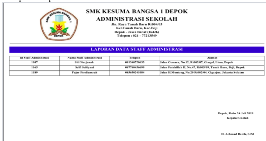
Gambar 9. Tampilan Laporan Data Staff Administrasi