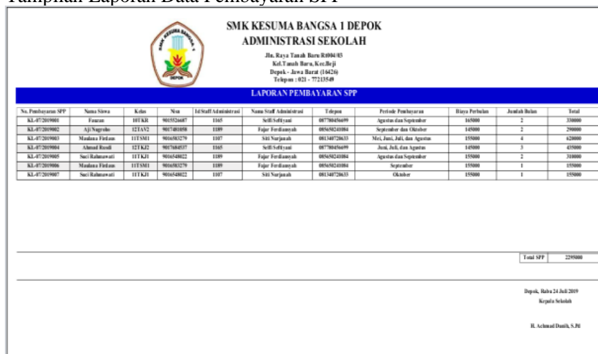
Gambar 11. Tampilan Laporan Data Pembayaran SPP