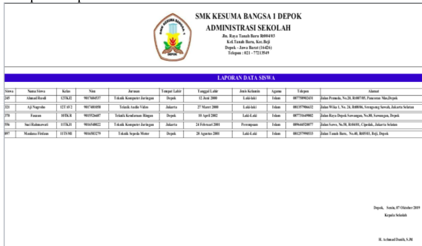
Gambar 10. Tampilan Laporan Data Siswa