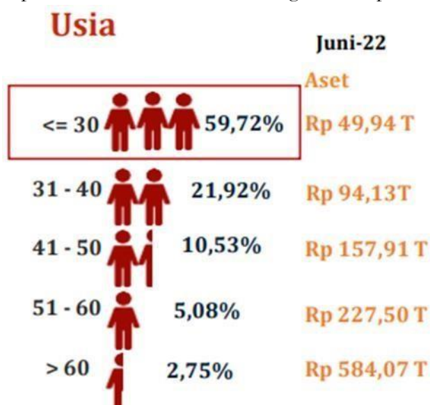
Gambar 1. Klasifikasi Berdasarkan Umur Jumlah Investor Pasar Modal

Pada saat ini tidak sedikit anak muda yang ingin melakukan investasi. Mayoritas investor Indonesia berusia di bawah 30 tahun pada Juni 2022, menurut statistik PT. Kustodian Sentral Efek Indonesia. Ini menandakan bahwa semakin sadarnya anak muda untuk mengelola keuangannya sejak dini. Fenomena ini diharapkan para millennial dan Gen Z dapat mendorong Indonesia sebagai sentral perekonomian dunia dalam rangka menciptakan Indonesia Emas 2045.