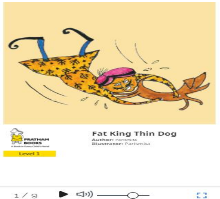
Gambar 2. Fiksi Realistis Kontemporer, Fat King Thin Dog

Dalam ranah fiksi, fiksi ilmiah mencakup unsur-unsur ilmu pengetahuan dan teknologi sebagai landasan konflik atau sebagai latar cerita.