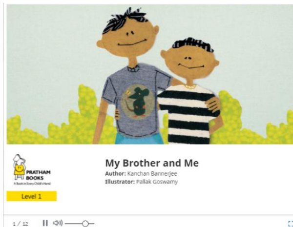
Gambar 4. NonFiksi, My Brother and Me

Berdasarkan penelitian Suyanto (2008), sebagai guru harus bisa membantu peserta didik dalam belajar bahasa Inggris dengan cara memberikan digital picture books yang sesuai dan tepat untuk pembelajar muda.