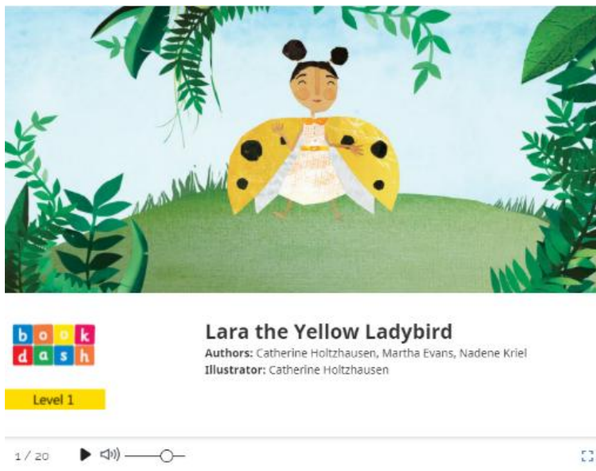
Gambar 1. Genre Fantasi, Lara the Yellow Ladybird

Dibawah ini terdapat variasi digital picture books yang disukai pembelajar muda bahasa Inggris sesuai genre. Galda dkk. (2014) mendeskripsikan genre populer dalam sastra anak, di antaranya termasuk fantasi, fiksi realistik kontemporer, fiksi ilmiah, fiksi sejarah, nonfiksi, puisi dan sajak. a. Fantasi, yang terdiri dari narasi yang termasuk pengaturan atau karakter aneh atau dunia lain, awalnya adalah genre paling populer sastra di kalangan anak-anak (Galda dkk., 2014).