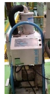
Gambar 2. Jet-loader .

Mesin jet-loader mekanisme yang digerakkan oleh tenaga yang digunakan untuk menggali, memindahkan atau mengangkat kerikil, pasir atau tanah. Mesin ini merupakan mesin konstruksi yang menggabungkan antara traktor, loader, dan backhoe [7].