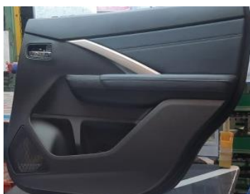
Gambar 5. Hasil Produksi

Pada gambar 5. merupakan hasil produksi door trim Mitsubishi Xpander yang akan di kkirim ke pihak customer atau masuk ke departemen logistic . hasil tersebut berbentuk satuan yang siap untuk langsung di pakai di bagian pintu mobil.