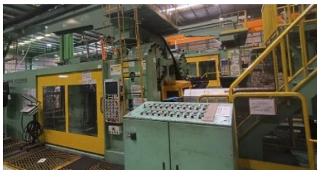
Gambar 3. Injection Molding.

Injection molding adalah metode pemrosesan material termoplastik yang mana material yang meleleh karena pemanasan, diinjeksikan oleh plunger ke dalam cetakan yang didinginkan oleh air, kemudian material tersebut akan menjadi dingin dan mengeras sehingga bisa dikeluarkan dari cetakan [9].