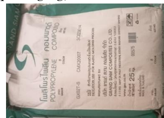
Gambar 4. Material PP

Jenis bahan yang di pakai di PT. XYZ untuk pembuatan door trim mobil Mitsubishi Xpander yaitu PP ( polypropylene ). Polypropylene adalah jenis matriks yang dapat digunakan diberbagai bidang polymer matrix composite (PMC) diantaranya bidang electric, packaging, dan otomotif [13].