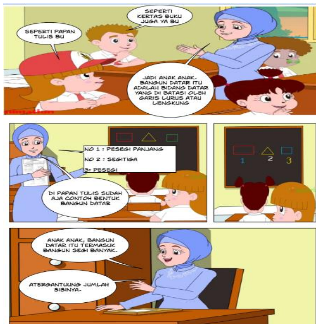
Gambar 4. Interaksi Antara Guru dan Siswa

Berdasarkan pada gambar 4. Pada bagian ini, guru memberikan pertanyaan, yang menstimulus siswa untuk berfikir dan berusaha menjawab pertanyaan yang diberikan oleh guru. Pendekatan scientific yang diterapkan pada bagian ini yaitu bertanya dan mengkomunikasikan.