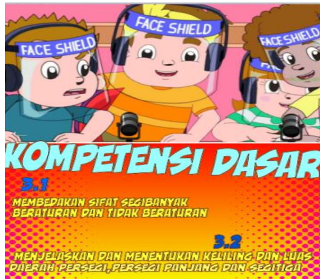
Gambar 2. Kompetensi Dasar

Berdasarkan pada gambar 2. Mendeskripsikan kompetensi dasar yang ada pada halaman depan komik yaitu Kompetensi 3.2 membedakan sifat segi banyak beraturan dan tidak beraturan dan kompetensi dasar 3.2 menjelaskan dan menentukan keliling.