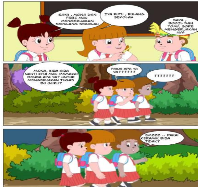
Gambar 6. Proses Diskusi Siswa dengan Siswa

Berdasarkan pada gambar 6. Proses diskusi antara siswa dengan siswa terkait tugas yang di berikan oleh guru tentang materi bangun datar. Pada bagian ini siswa bernalar secara realistik tentang konsep bangun datar yang telah dijelaskan saat pembelajaran, yang selanjutnya menjadi bahan pertanyaan atau diskusi dengan orang tua siswa.