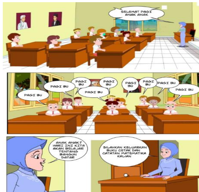
Gambar 3. Proses Pembelajaran di Kelas

Berdasarkan pada gambar 2. Mendeskripsikan kompetensi dasar yang ada pada halaman depan komik yaitu Kompetensi 3.2 membedakan sifat segi banyak beraturan dan tidak beraturan dan kompetensi dasar 3.2 menjelaskan dan menentukan keliling.