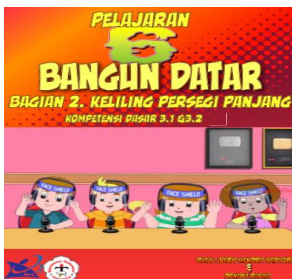
Gambar 1. Sampul Komik

Berikut adalah komik berbasis scinetific yang telah didesain dengan software comic life dan dikembangkan dengan metode Research and Development-4D