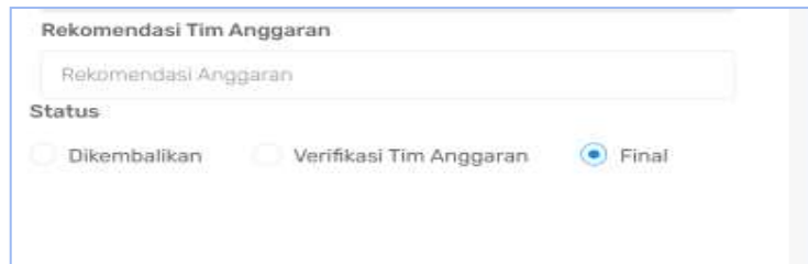
Gambar 4. Fitur Verifikasi Tim Anggaran

Tampilan pada Gambar 4, merupakan tampilan fitur verifikasi Tim Anggaran. Setelah itu pada fitur verifikasi akan dilakukan pengujian dan untuk hasil pengujian dapat dilihat pada Tabel 3.