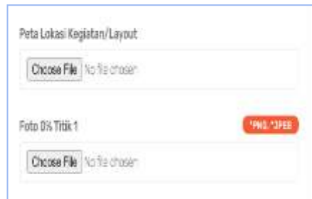
Gambar 3. Fitur Entri Data

Tampilan pada Gambar 3, merupakan tampilan fitur entri data. Setelah itu pada fitur entri data akan dilakukan pengujian dan untuk hasil pengujian dapat dilihat pada Tabel 2.