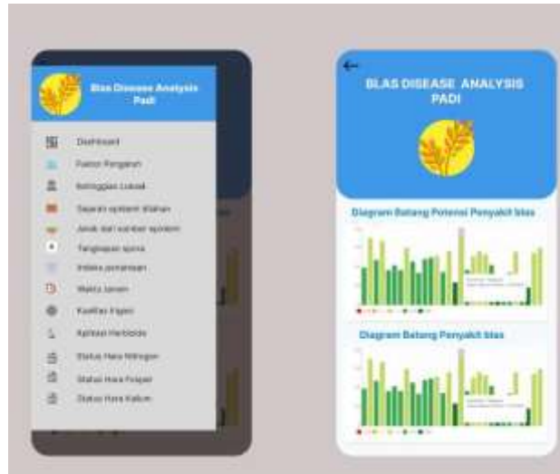
Gambar 3. Tampilan Interface sistem

Tampilan pada halaman mobile berupa data diagram batang yang menunjukkan nilai dan warna untuk melihat potensi serangan hama penyakit blas, dilihat pada Gambar 3